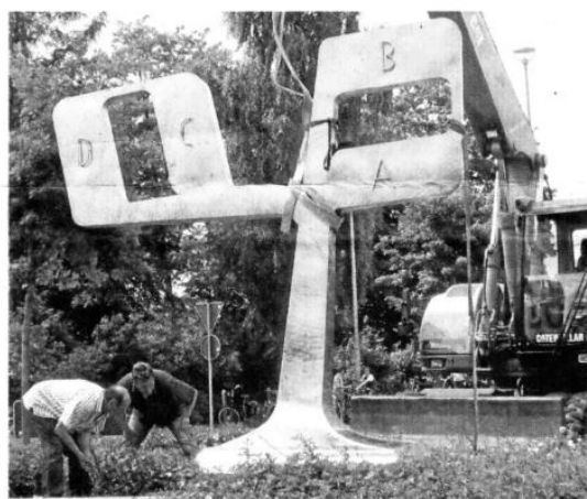
Seit 2007 schmückt ein Abbild des ursprünglichen Grundrisses Reckenfeld den Kreisel am Moorweg/Jägerweg.

und alle, die sich für die Informationstafel stark gemacht haben, hoffen auf viele Besucher. Für das leibliche Wohl ist gesorgt. bec